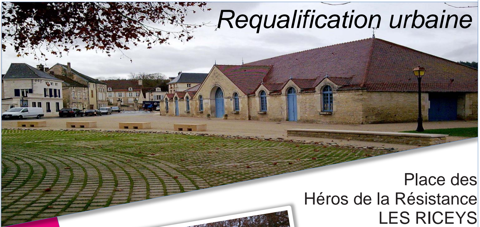
Place des Héros de la Résistance LES RICEYS